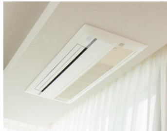
Built-in air conditioner

リビングダイニングとすべての居室にビルトインエアコンを標準装備しています。すっきりとした室内は優雅な印象に。